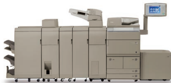
Gama dispositivos blanco y negro imageRUNNER ADVANCE 8000