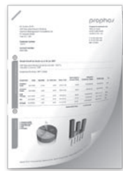
Grapado y taladrado