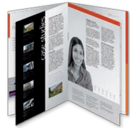
Encuadernación en caballete y corte