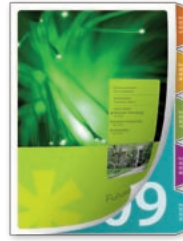
Impresión de fichas