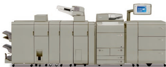
Gama dispositivos color imageRUNNER ADVANCE C9000 Pro

Sea cual sea el ámbito del proyecto de producción, la gama imageRUNNER ADVANCE de Entrada de Producción siempre logra una calidad insuperable. Dado que incorpora una gran variedad de técnicas de calidad de imagen, los resultados siempre presentan unos colores vivos y uniformes, además de una precisa densidad de medios tonos. Sus múltiples funcionalidades de gestión de soportes de impresión y sus opciones de acabado de gama alta – como la creación de folletos, el taladrado profesional o las posibilidades avanzadas de plegado – garantizan que las impresiones superarán incluso las expectativas más exigentes.