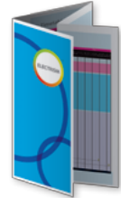
Plegado doble paralelo