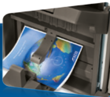
Finalizador para Folletos