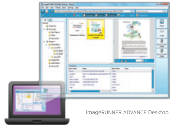
imageRUNNER ADVANCE Desktop

Con una amplia gama de soluciones de software, Canon le da a su negocio una ventaja en ahorro de tiempo, reducción de costos y calidad mejorada. El utilitario Workflow Composer reduce las operaciones frecuentes de varios pasos al toque de un botón en el Menú Rápido. Usted puede asignarle nombre a los botones de la interfaz para que concuerden con los procesos de su negocio. Con la plataforma de desarrollo MEAP® de Canon, usted puede obtener ventaja de la adición de aplicaciones para ampliar sus capacidades.