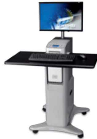
Hardware controlador de impresión ColorPASS-GX300 con Interfaz Integrada y Pedestal A1

Los usuarios actuales desean tener más control sobre sus entornos de impresión. La nueva Herramienta de Configuración del Software Controlador de Canon, le ofrece todo esto, mediante la fijación de perfiles específicos, personalizados y por omisión. Usted puede controlar los costos seleccionando características fáciles de usar tales como la impresión bilateral o mejorar la seguridad con el uso de un sello de agua obligatorio.