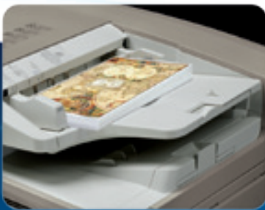
Alimentador de Documentos Bilaterales de Un Paso

Ya sea desde el modelo imageRUNNER ADVANCE o desde su propio escritorio, usted puede tener acceso directo a las funciones que facilitan su trabajo. El utilitario imageRUNNER ADVANCE Desktop cuenta con una interfaz de PC clara e integral, que transforma su computadora en una estación central de comando. Ahora, usted puede realizar tareas personales de flujo de trabajo de documentos, tales como archivar, combinar y distribuir, todo esto desde el escritorio, sencillamente con “arrastrar y soltar”. También puede buscar documentos fácilmente, e incluso supervisar el estado de un trabajo desde cualquier sitio en la red.