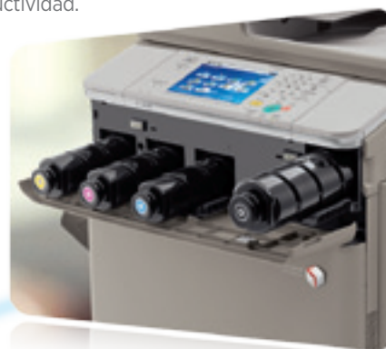
Botellas de Tóner

Con los modelos imageRUNNER ADVANCE C7065/C7055, la productividad continua que su negocio exige está garantizada. Las notificaciones del estado lo mantienen un paso adelante de los acontecimientos, además el tóner y el papel pueden reemplazarse sobre la marcha. Si no se encuentra disponible el tamaño o el material correcto de papel, el sistema puede empezar el próximo trabajo sin demora para contribuir a maximizar la productividad.