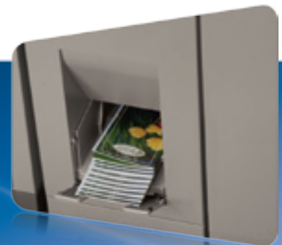
Unidad Dobladora de Papel