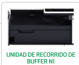
UNIDAD DE RECORRIDO DE BUFFER NI