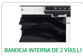
BANDEJA INTERNA DE 2 VÍAS LI