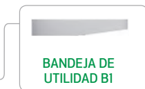
BANDEJA DE UTILIDAD B1