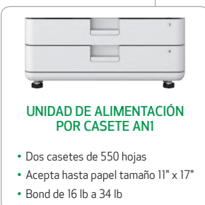
UNIDAD DE ALIMENTACIÓN POR CASETE ANI