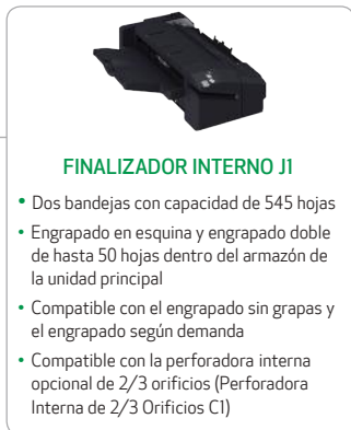
FINALIZADOR INTERNO J1