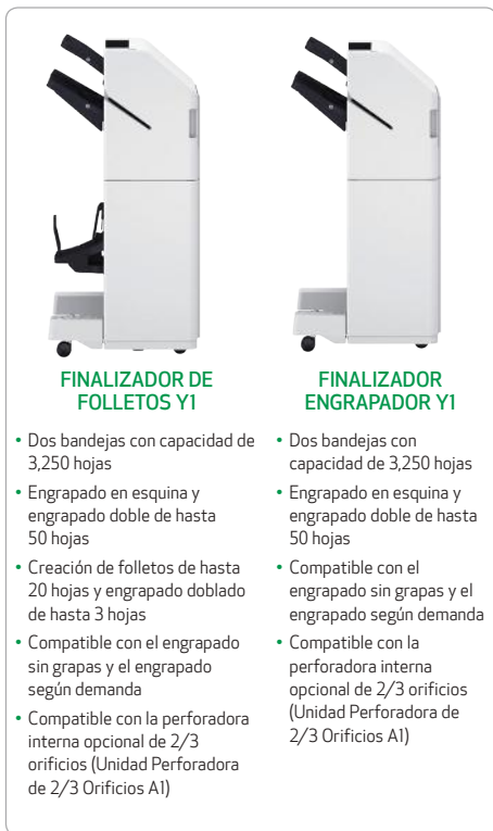
FINALIZADOR DE FOLLETOS Y1

Opciones para los modelos 4535i II/4525i II. El DADF de un paso es estándar en los modelos 4551i II/4545i II.