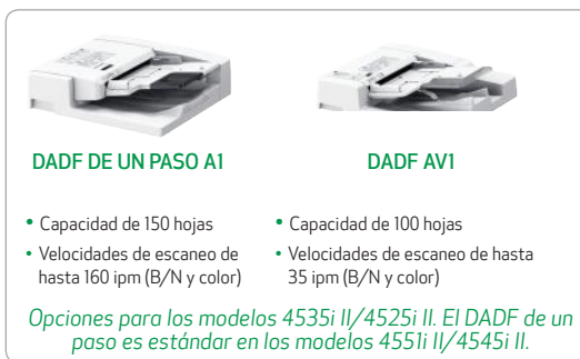
DADF DE UN PASO A1