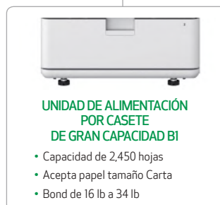
UNIDAD DE ALIMENTACIÓN POR CASETE DE GRAN CAPACIDAD BI