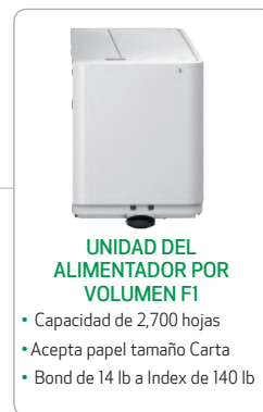
UNIDAD DEL ALIMENTADOR POR VOLUMEN F1